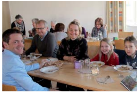
Gemeinsames Suppenessen im Pfarrzentrum. Rammerstorfer

Unter dem Motto „Teilen spendet Zukunft“ stand der 2. Fastensonntag.