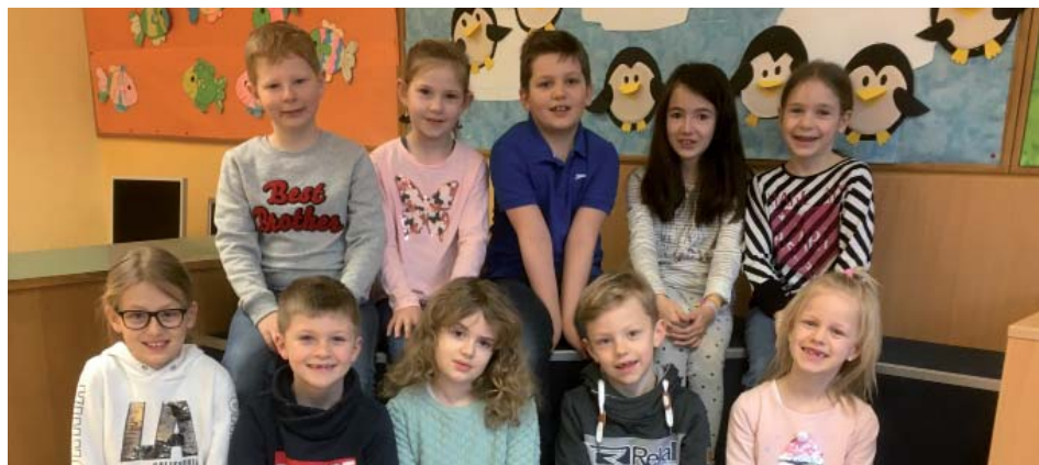
10 Kinder bereiten sich auf die Erstkommunion vor. Arzt

Neun Kinder aus der zweiten und heuer auch ein Kind aus der ersten Klasse Volksschule bereiten sich in diesem Jahr auf den Empfang des Sakraments der heiligen Kommunion vor. Im Religionsunterricht und in der Erstkommunionsvorbereitung mit den Eltern beschäftigen sie sich dabei mit dem Thema: „durch Jesus verwandelt werden“.