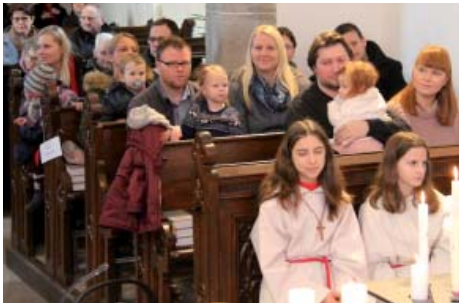
Die Taufeltern mit ihren Täuflingen in der Kirche. Rammerstorfer

Am Sonntag, 02.02.20 feierte die Pfarre den Taufelternsonntag. Zu diesem Gottesdienst waren besonders jene Familien eingeladen, die ihre Kinder letztes bzw. vorletztes Jahr in Goldwörth haben taufen lassen.