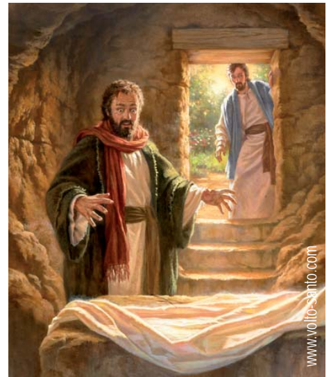
Johannes und Petrus im Grab.

Aus dem heiligen Osterevangelium nach Johannes (Joh 20, 1-9)