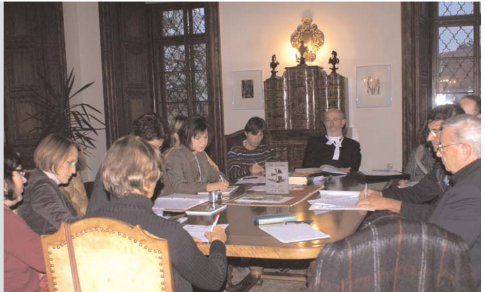
Pfarrgemeinderatssitzung im Augustiner Chorherrenstift St. Florian