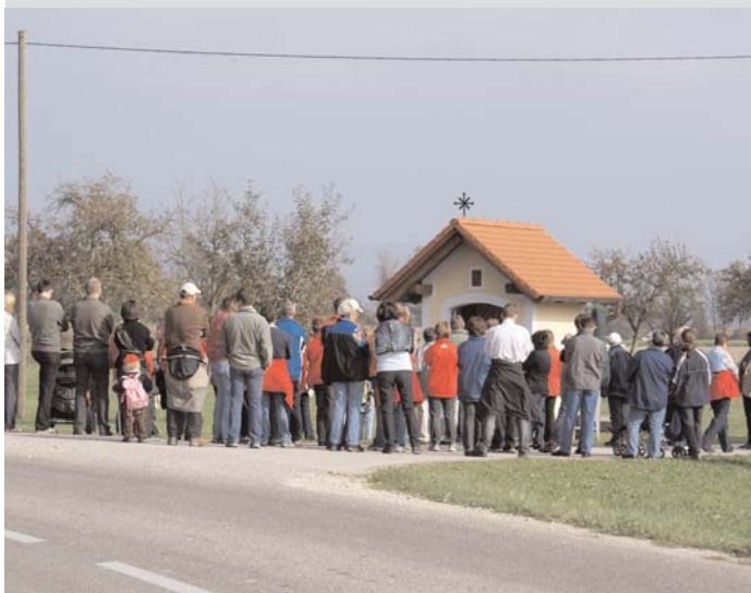
Bei der Zehetner Kapelle

tionen bei der Fronleichnamsprozession. An der "Haslingerkapelle" und an der "Zehetnerkapelle" wird beim Fronleichnamsumzug seit 35 Jahren nicht mehr vorbeigegangen. Auf halber Strecke gab es Kaffee, Kuchen und Getränke zur Stärkung. Der Abschluss fand mit einer kurzen Andacht bei der "Hubertuskapelle", auch als "Jägerkapelle" bekannt, statt. Den Besitzern der Kapellen gebührt ein Danke für die Erhaltung und Pflege solcher Kleindenkmäler, da sie ja auch wesentlich zum Erscheinungsbild unserer Pfarre beitragen.